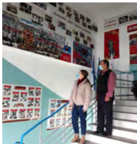
Нам дороги эти позабыть нельзя...