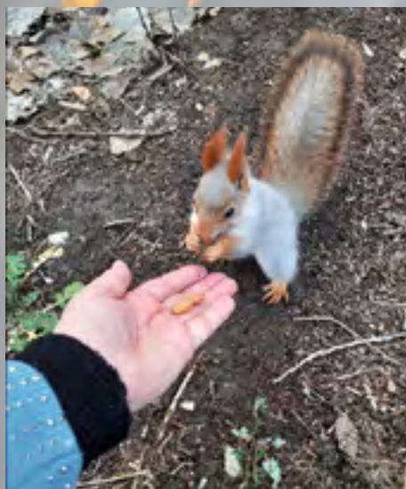
Дикий зверь, одетый в мех, на руке грызёт орех