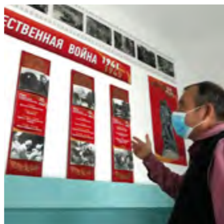
Кто живёт, знайте, кто знает, помните, кто помнит, живите...